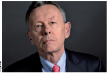
GREGOR SCHÖLLGEN Jahrgang 1932, ist Professor für Neuere Geschichte an der Universität Erlangen und lehrte in New York, Oxford und London. Er konzipiert und bearbeitet historische Ausstellungen und Dokumentationen, schreibt für Presse, Hörfunk und Fernsehen, ist Mitherausgeber der Altona der Auswärtigen Amt und des Nachlasses von Willy Brandt sowie Autor zahlreicher populärer Sachbücher und Biographien.

Gerhard Schröder polarisiert. Ganz gleich ob er als Junge-Abgeordneter die eigene Truppe aufmischt, als junger Bundestag-Abgeordneter den politischen Gegner in Wäldern bringt, als Rechtsanwalt Außenminister vertritt oder als Ministerpräsident den Alleingang zur Perfektion entwirft – der von der Stimmen- die Ausleger aus runderdämmtem Milieu hat immer provoziert. Als Bundeskanzler und SPD-Vorsitzender verweigert er den USA die Geldpolitik im Kalkül mit seiner Agenda 2010. Reformpolitik riskiert er die Kanzlerschaft, und auch als umtriebiger Wirtschaftsberater und Putin-Freund trotz er aller Kritik. Der vielfach bewährte Biograph Gregor Schöllgen (FRU) hatte unangestrichelten Zugang zu sämtlichen Papieren Gerhard Schröders und sprach mit vielen Weggefährten – Freunden und Verwandten, Gegnern und Neidern, Förderern und Bezwingern –, die sich ungewohnt offen äußerten. Schöllgen gelingt so die erste große und höchst interessante Biographie dieser ungewöhnlichen Politikerpersönlichkeit.